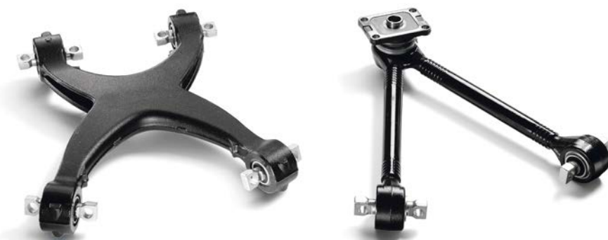
Треугольные и четырехточечные рычаги подвески MAN от 41 308 руб. с НДС