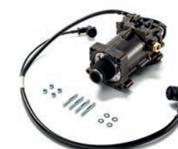
Главные цилиндры сцепления MAN от 9 075 руб. с НДС

Включают в себя диск сцепления, нажимной диск сцепления, подшипник выключения сцепления, направляющий подшипник и необходимые болты крепления — в комплекте с ценовым преимуществом. от 50 115 руб. с НДС