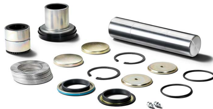
Ремкомплекты для поворотной цапфы MAN от 17 165 руб. с НДС