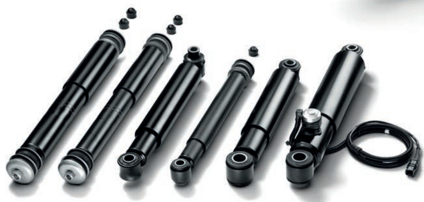
Амортизаторы MAN от 13 435 руб. с НДС