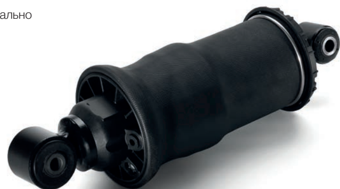
Пневмобаллоны MAN от 8 142 руб. с НДС