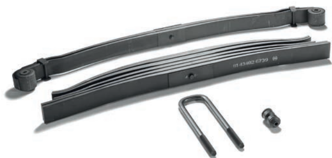
Листовые рессоры MAN от 29 259 руб. с НДС