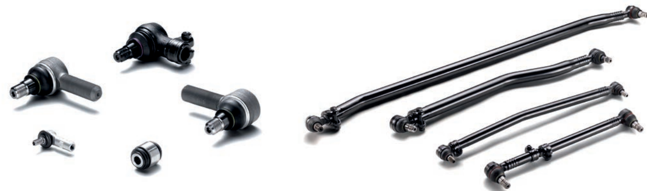
Рулевые наконечники MAN от 10 024 руб. с НДС